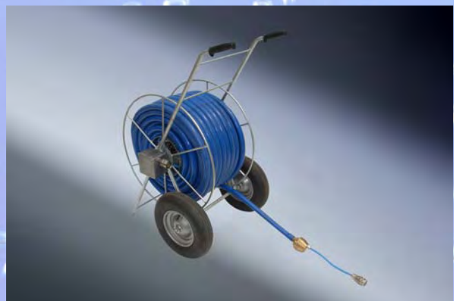
Kompakt-Schlauch mit Trommel